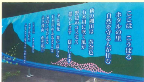
上の広場には「こうばるのうた」の看板